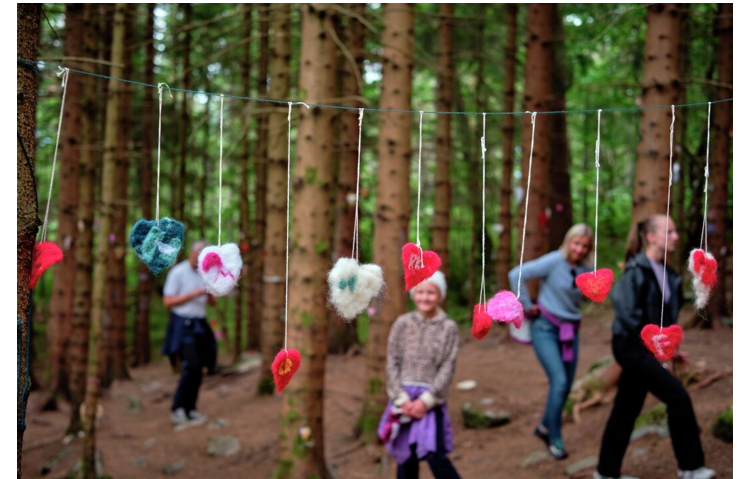
Trivselsskogen på Sandane.